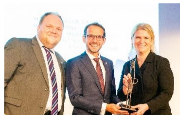
Section Actions collectives

Le Prix Claude-Beaudoin - Excellence - Sections de droit a pour but de souligner l'excellence du programme de formation continue ainsi que les autres réalisations d'une section.